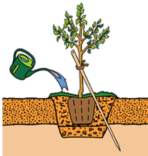
korrekte Pflanzung für Obstbäume im Container

Im Container gezogene Obstbäume können das ganze Jahr hindurch gepflanzt werden. Der Pflanzschnitt an der Krone ist nur ausserhalb der Vegetations-Periode erforderlich.